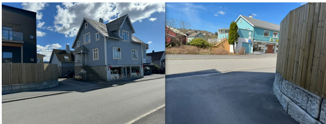
Bilder av avkjørsel fra 56/33 til fv. 4246 Gamleveien. Til venstre: avkjørselen sett fra vestsiden av Gamleveien. Til høyre: sett fra 56/33 mot Gamleveien.